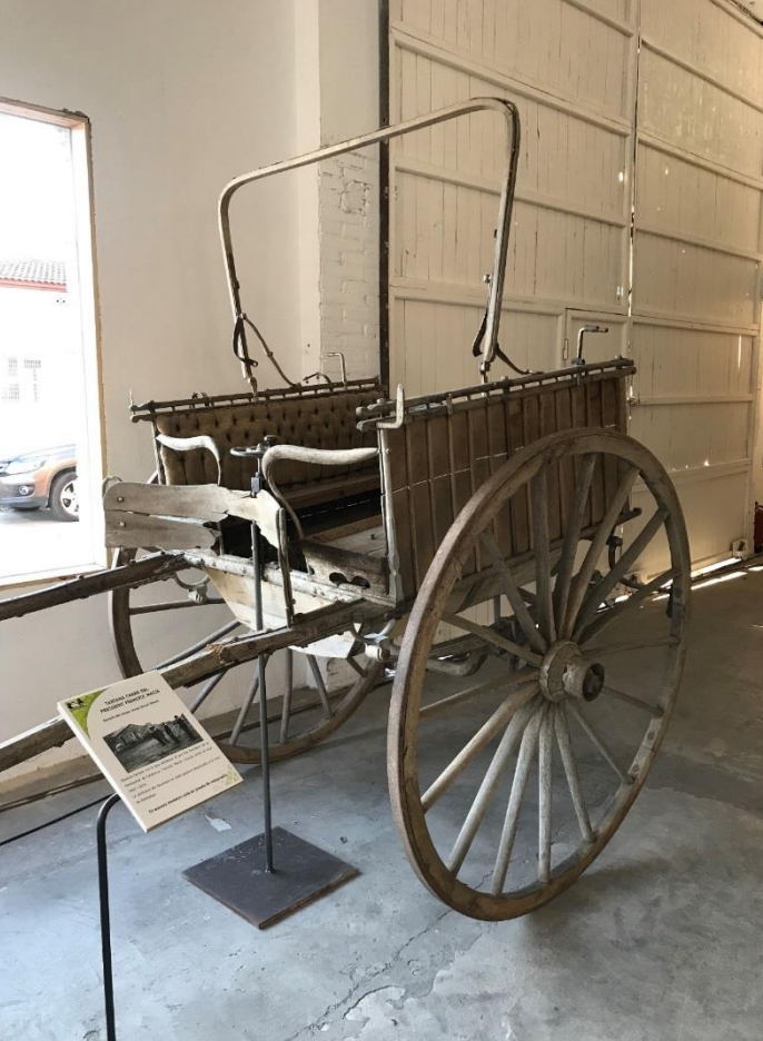
Tartana que va pertànyer al president Francesc Macià

Aquesta exposició vol proporcionar un alt nivell de consciència pública i el suport necessari per a la supervivència del patrimoni cultural i ajudar a sensibilitzar sobre la seva importància a la nostra vila.